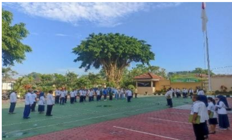
Apel Bersama dihalaman Pengadilan Negeri Blitar, Senin 12 Februari 2024.