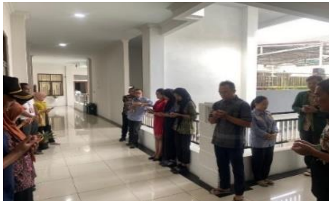
doa dan makan Bersama, di ruangan dapur Bersama. Jumat 01 Maret 2024.