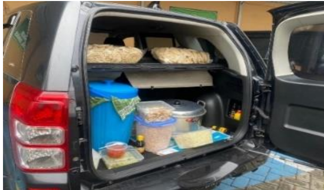
Mempersiapkan makan Bersama, dari parkir ke dapur Bersama, Jumat 01 Maret 2024.