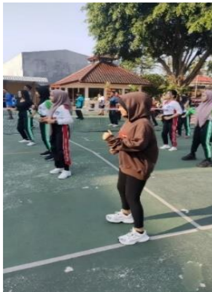
Olahraga senam Bersama, dihalaman Pengadilan Negeri Blitar, Jumat 18 Februari 2024.