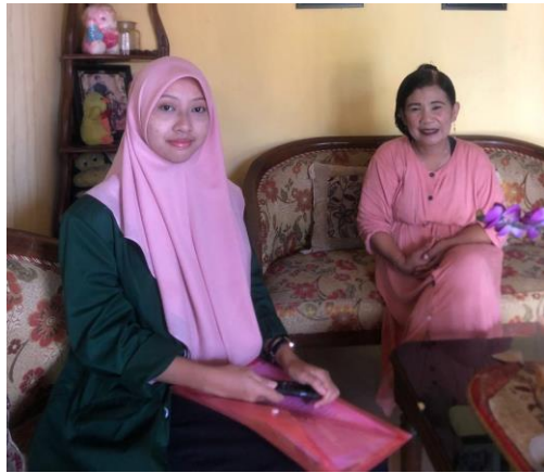
Foto bersama dengan Ibu U selaku pelaku usaha penerima pembiayaan di Koperasi Wanita "Maju Makmur" Desa Minggirsari