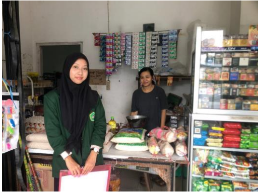
Foto bersama dan wawancara dengan Ibu Y selaku pelaku usaha penerima pembiayaan di Koperasi Wanita "Maju Makmur" Desa Minggirsari