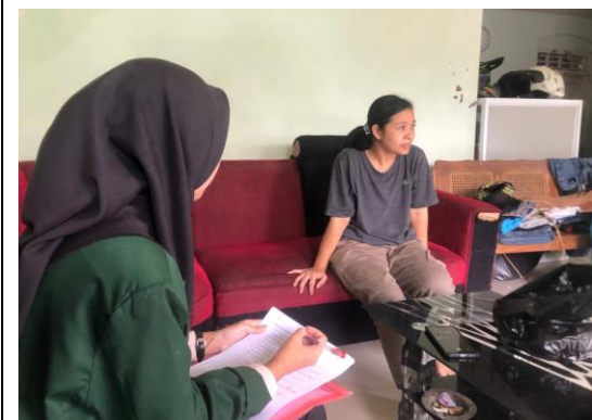
Wawancara dengan Ibu Y selaku pelaku usaha penerima pembiayaan di Koperasi Wanita "Maju Makmur" Desa Minggirsari