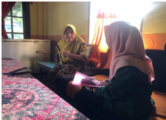
Wawancara dengan Ibu M selaku pelaku usaha penerima pembiayaan di Koperasi Wanita "Maju Makmur" Desa Minggirsari