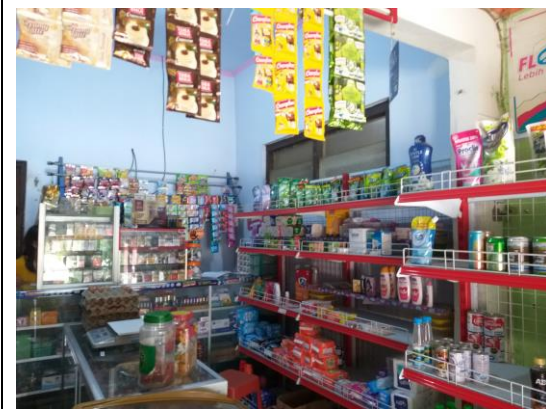
Kondisi toko Ibu S selaku pelaku usaha penerima pembiayaan di Koperasi Wanita "Maju Makmur" Desa Minggirsari