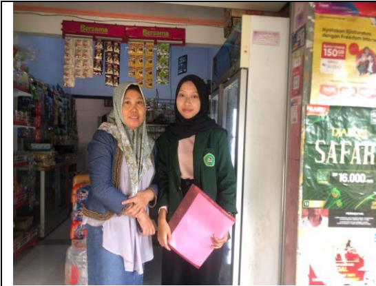
Foto bersama dan wawancara dengan Ibu S selaku pelaku usaha penerima pembiayaan di Koperasi Wanita "Maju Makmur" Desa Minggirsari