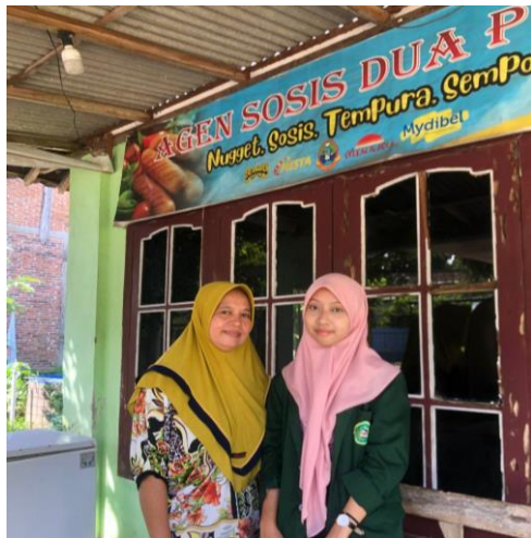
Foto bersama dan wawancara dengan Ibu M selaku pelaku usaha penerima pembiayaan di Koperasi Wanita "Maju Makmur" Desa Minggirsari