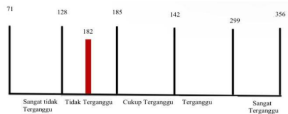
Gambar 2. Diagram Kategori Batas Skor Nilai Persepsi Negatif Masyarakat