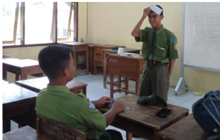
Guess the Thing Game