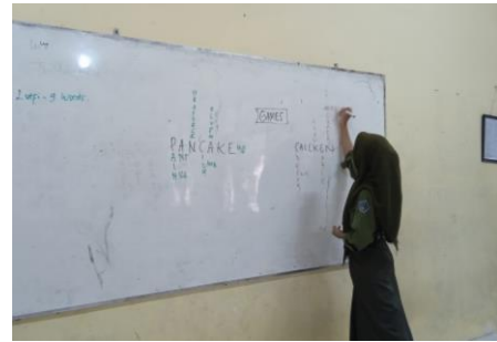
Guess the Word Game