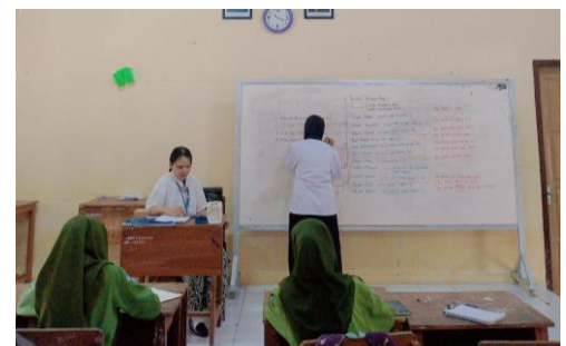
Observasi (1) Siswa maju *sukarela untuk menjawab pertanyaan mengenai Auxiliary Verbs dan Passive Voice.