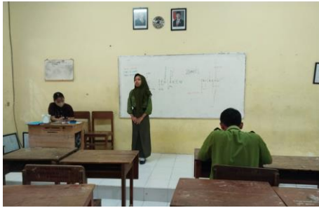
Observasi (2) Setoran hafalan kata