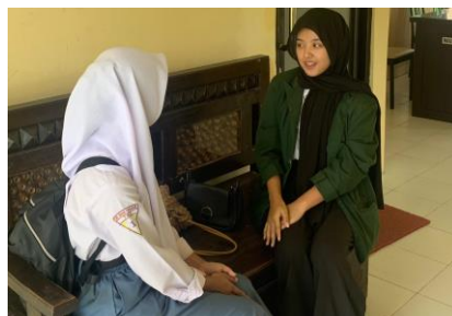
Wawancara dengan siswa 1