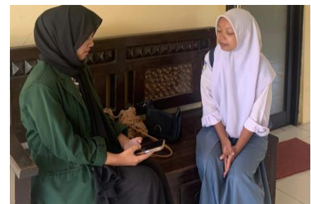
Wawancara dengan siswa 2