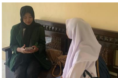
Wawancara dengan siswa 3