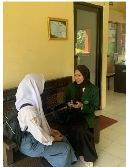
Interview with student of XI-TKJ2 Class