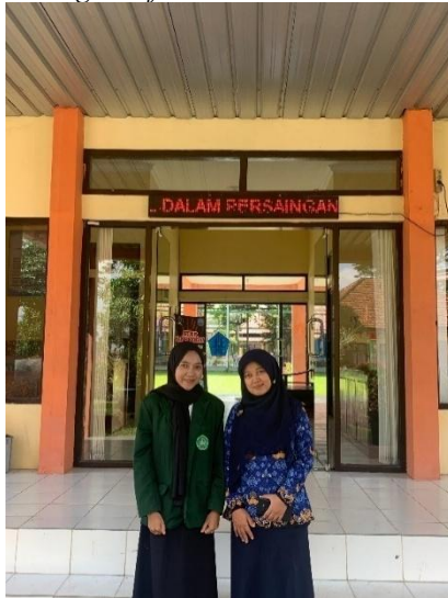
Photo with the English teacher