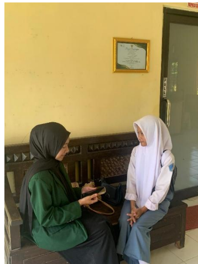
Interview with student of XI-TKJ2 Class