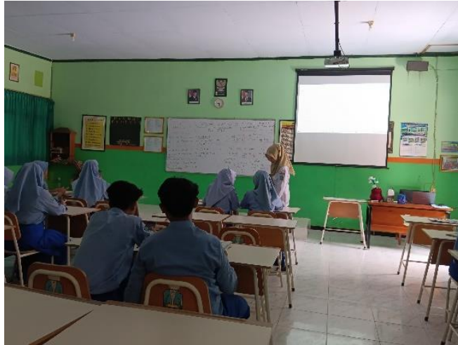
The teacher actively provides assistance if there are students who do not understand.