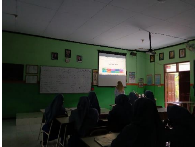
The teacher actively gives feedback to students.