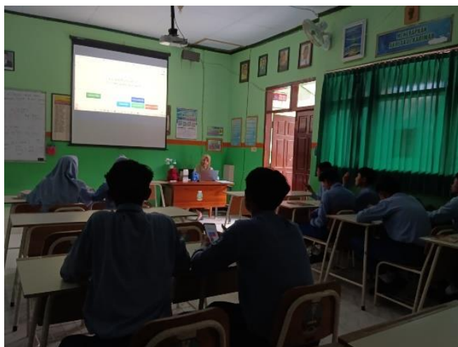
Students listen carefully to the teacher's re-explanation.