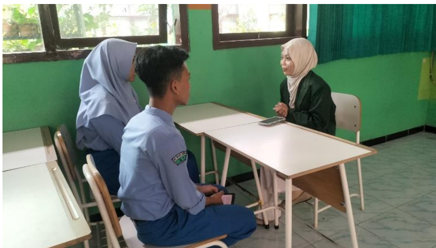
Interview with students of SMAN 1 Srengat.