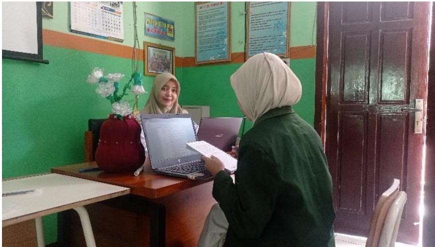
Interview with the teacher of SMAN 1 Srengat.