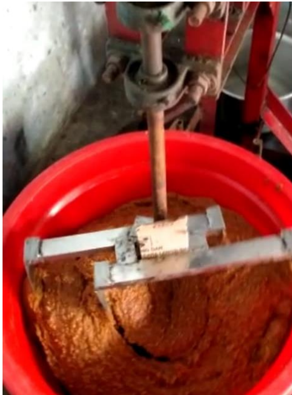
Gambar 4 Proses Penggilingan Bahan Pembuatan Sambal Pecel