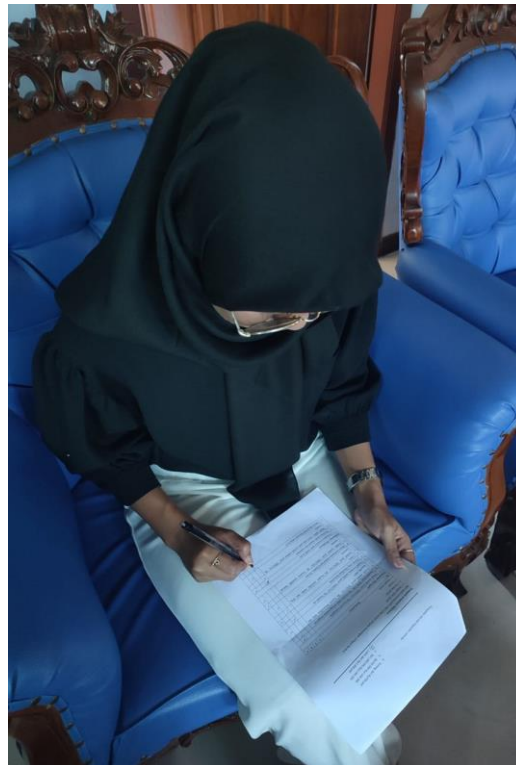
Gambar 2 Wawancara Responden