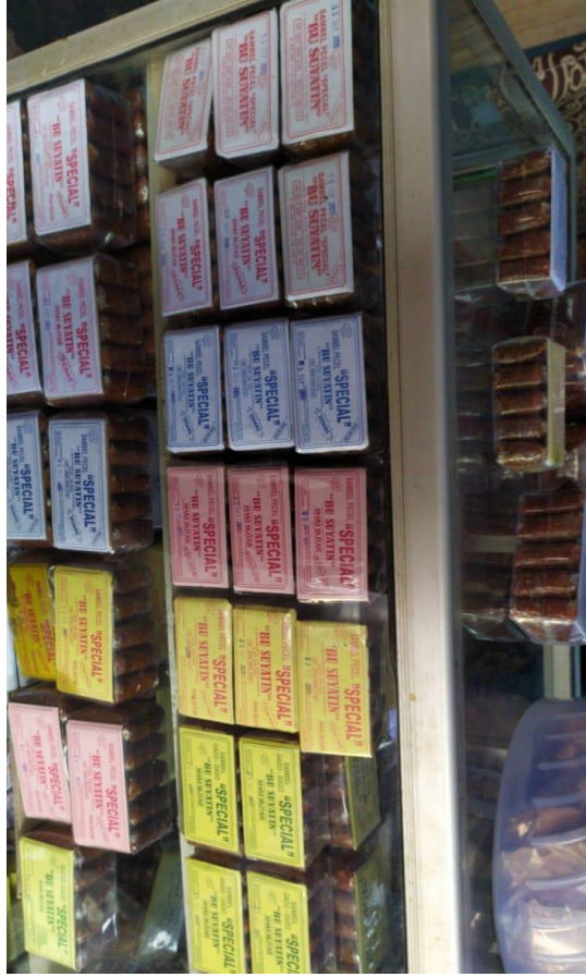
Gambar 5 Foto Produk