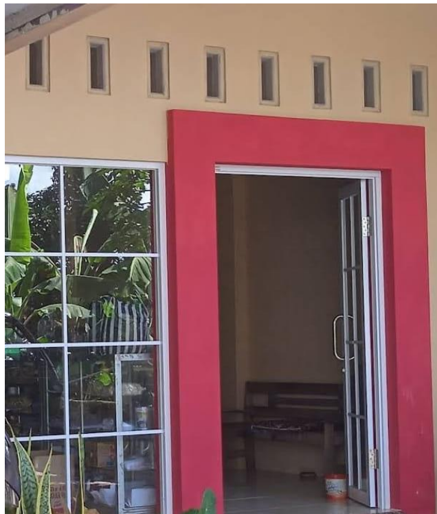
Gambar 2 Tempat Produksi Sambal Pecel Bu Suyatin Ngadirejo