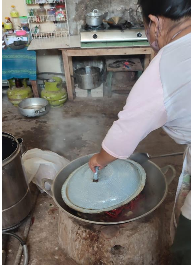
Gambar 3 Proses Menyangrai Bahan Pembuatan Sambal Pecel