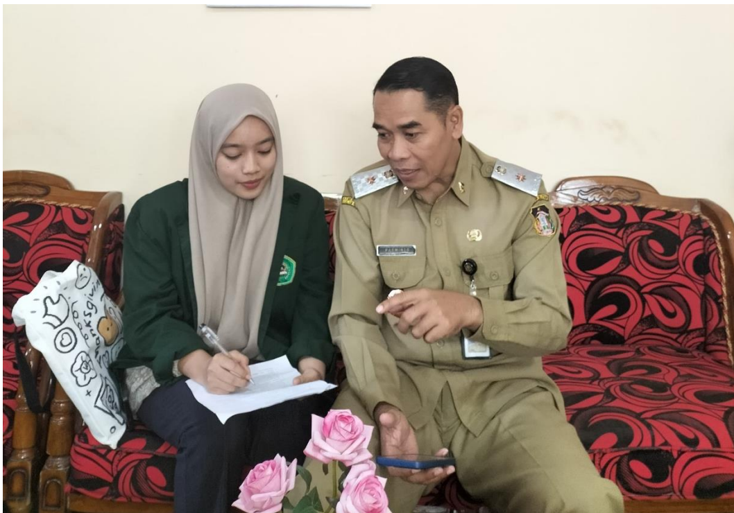
Dokumentasi 2. Keterangan: Dokumentasi Wawancara dengan Kepala Dinas Pemberdayaan Perempuan, Perlindungan Anak, Pengendalian Penduduk, dan Keluarga Berencana Kota Bitar