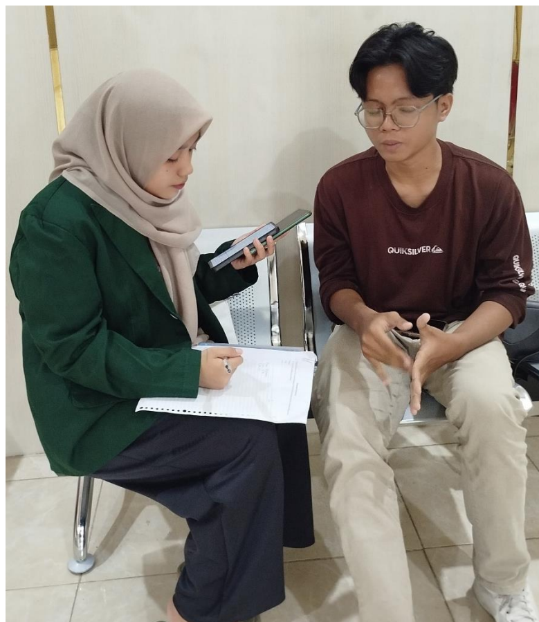
Dokumentasi 6. Keterangan: Dokumentasi Wawancara dengan Juara 3 Putra Duta Generasi Berencana (GenRe) Kota Blitar