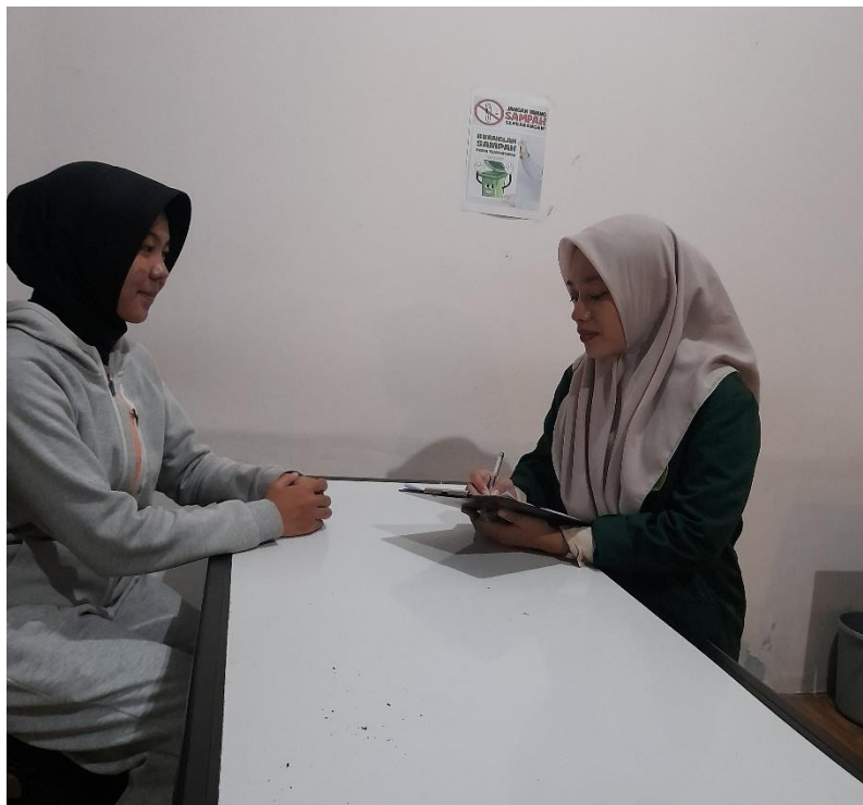
Dokumentasi 4. Keterangan: Dokumentasi Wawancara dengan Juara 1 Putri Duta Generasi Berencana (GenRe) Kota Blitar