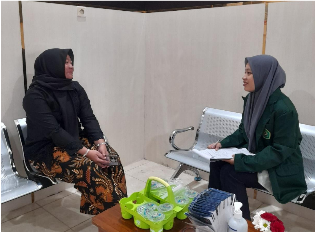
Dokumentasi 3. Keterangan: Dokumentasi Wawancara dengan Ketua Forum Generasi Berencana (GenRe) Kota Blitar