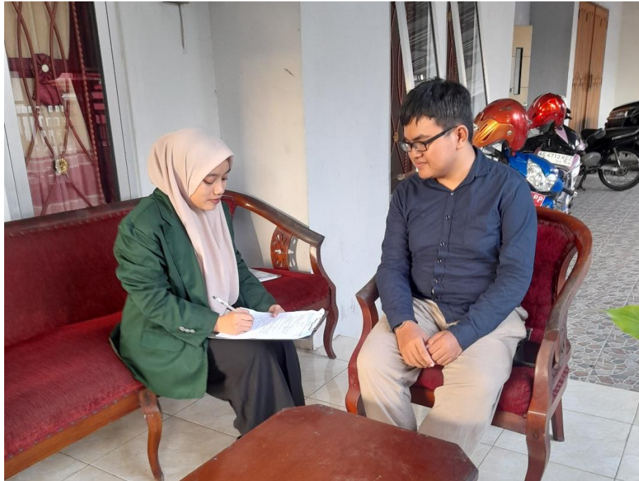
Dokumentasi 5. Keterangan: Dokumentasi Wawancara dengan Juara 1 Putra Duta Generasi Berencana (GenRe) Kota Blitar