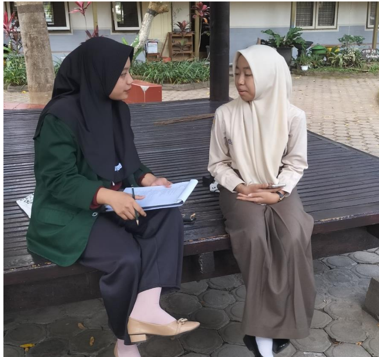
Dokumentasi 8. Keterangan: Dokumentasi Wawancara dengan Anak yang Disosialisasi oleh Duta Generasi Berencana (GenRe) Kota Blitar (SMAN 1 Blitar)