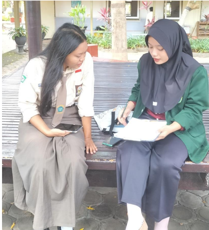
Dokumentasi 9. Keterangan: Dokumentasi Wawancara dengan Anak yang Disosialisasi oleh Duta Generasi Berencana (GenRe) Kota Blitar (SMAN 1 Blitar)