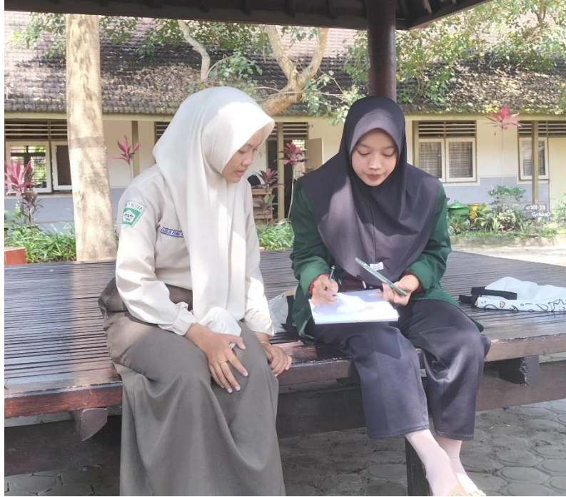
Dokumentasi 7. Keterangan: Dokumentasi Wawancara dengan Anak yang Disosialisasi oleh Duta Generasi Berencana (GenRe) Kota Blitar (SMAN 1 Blitar)