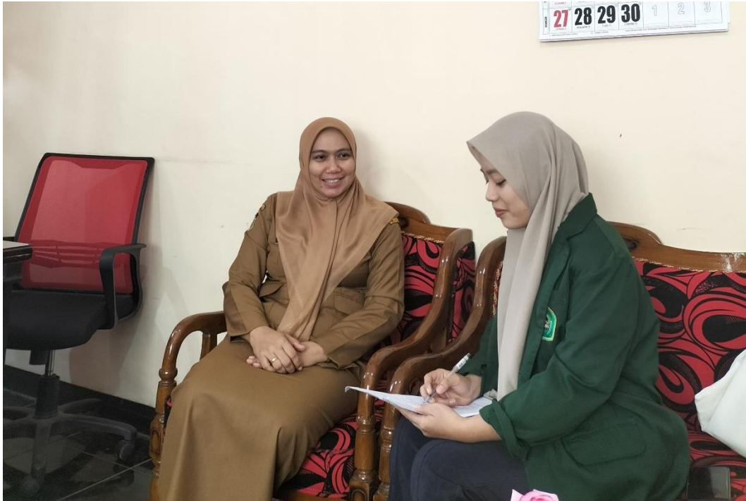
Dokumentasi 1. Keterangan: Dokumentasi Wawancara dengan Kabid P2KB Pembina Forum Generasi Berencana (GenRe) Kota Blitar