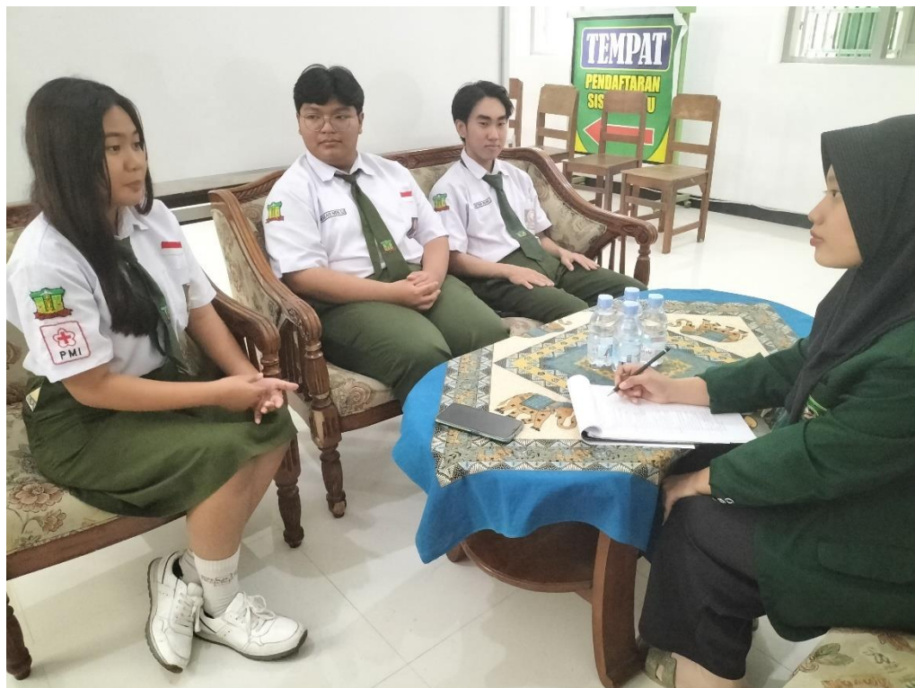
Dokumentasi 10. Keterangan: Dokumentasi Wawancara dengan Anak yang Disosialisasi oleh Duta Generasi Berencana (GenRe) Kota Blitar (SMAK Diponegoro)